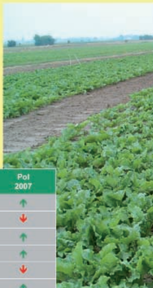
Tabella 7 - varietà con parametri modificati nel 2007 rispetto al 2006

Questa prova si prefigge lo scopo di valutare eventuali differenze produttive (Peso radici e Polarizzazione) confrontando tutte le cultivar della serie Base con le stesse commercializzate l'anno precedente. I risultati di questa prova non evidenziano significative variazioni tali da sostenere un cambiamento delle caratteristiche tipologiche delle varietà in esame. Tuttavia, segnaliamo a titolo informativo, che la varietà Puma , rispetto al seme dell'anno precedente, presenta un miglioramento in resa radici di poco superiore al 6% .